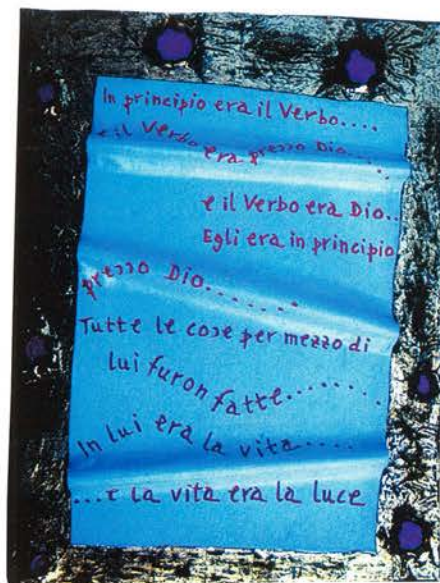
Oronzo LIUZZI - Fasano (Brindisi), 1949 "Il dono del verbo", 2000 Tecnica mista su tela, cm. 80 x 60