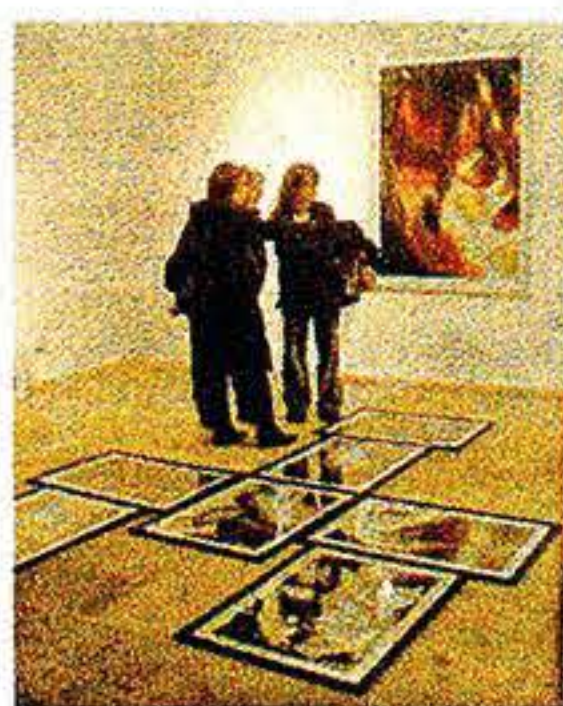
LO SPAZIO Nelle foto il Museo Nuova Era nel cuore di Bari vecchia

Da domani nello spazio di piazza del Ferrarese la collettiva "Videoplace" per celebrare i vent'anni del Museo Nuova Era