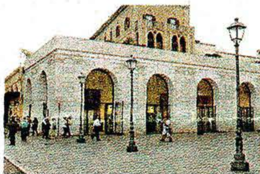
L'AGENDA Domani alla sala Murat (nella foto) s'inaugura alle 19 l'evento espositivo "Videoplace"